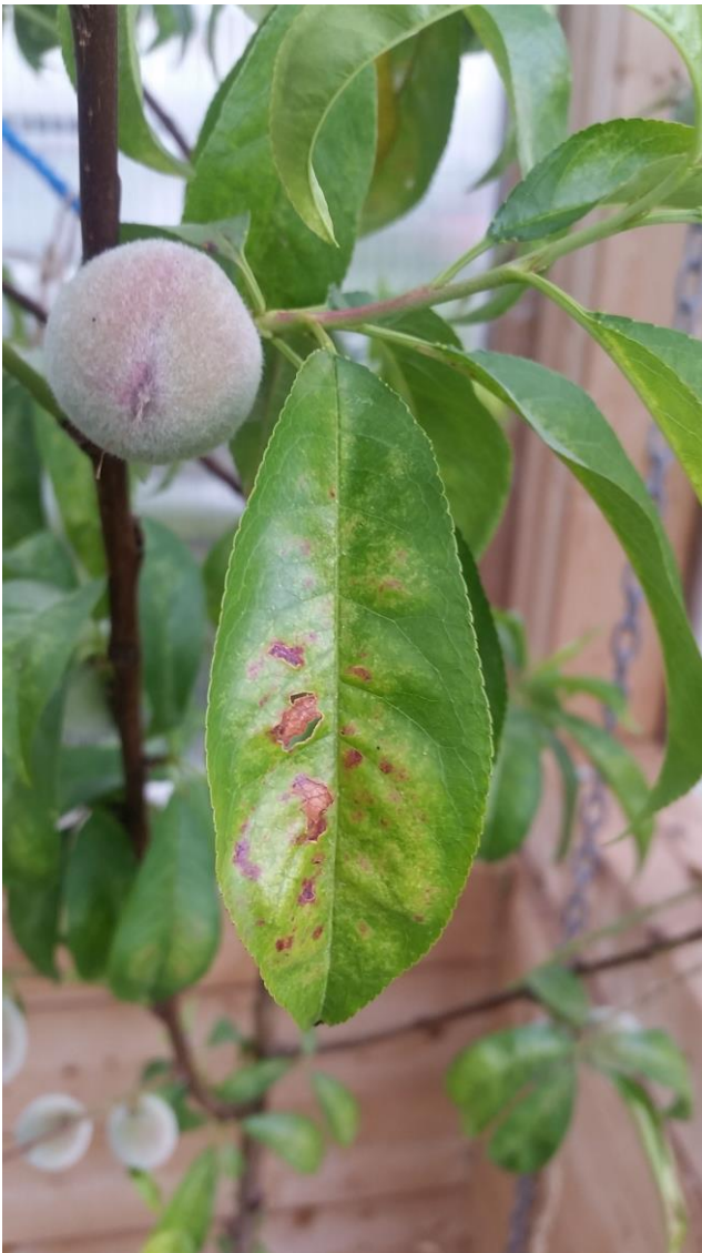
Bilete av ferskentreet før spraying med EM-Aktiv