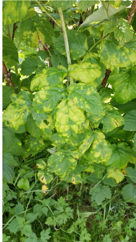
- og etter behandling med EM-Aktiv

Bringebærplantene har i fleire år vist teikn på klorose på årsskota utpå sommaren. Det har ført til at mange skot har vore svake når vinteren kom, og sommaren etter har dei ikkje vorte ordentleg grøne.