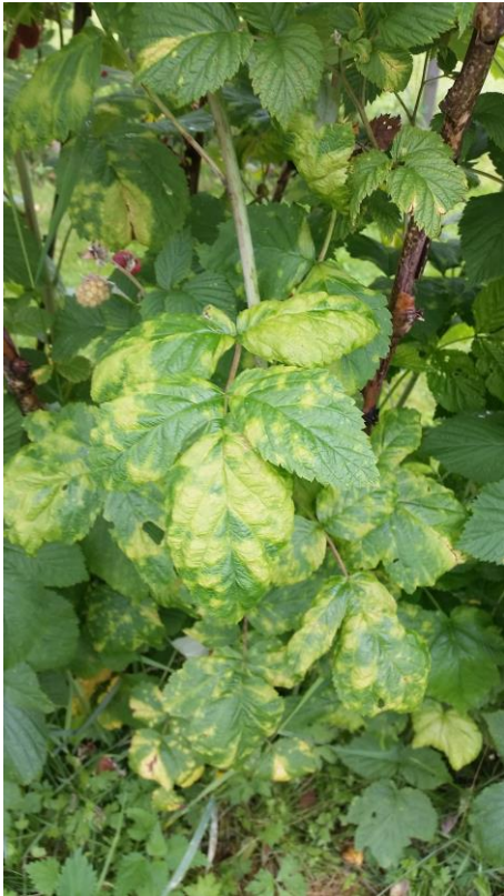
Klorose før behandling med EM-Aktiv